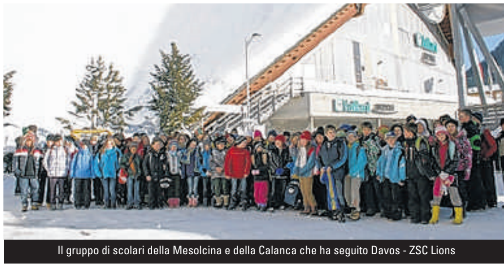
Il gruppo di scolari della Mesolcina e della Calanca che ha seguito Davos - ZSC Lions

Domenica scorsa, alla Vaillant Arena era ospite il Ginevra Servette e tra il pubblico c'era anche una ventina di soci della Federazione svizzera di nuoto per handicappati, ai quali il pubblico dello stadio davosiano ha riservato un lungo e caloroso applauso.