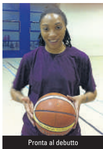
Pronta al debutto