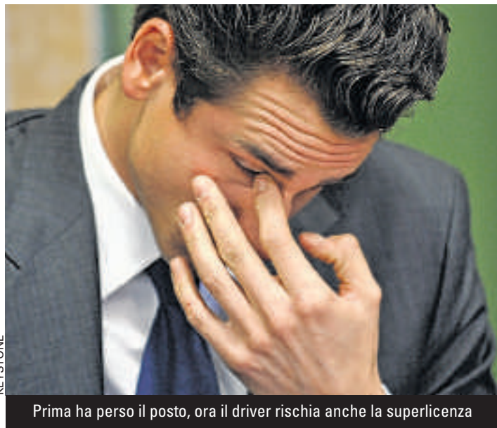
Prima ha perso il posto, ora il driver rischia anche la superlicenza

A seguito della denuncia di Lux – che si era dovuto far medicare con 24 punti di sutura (la ferita era di nove centimetri) –, Sutil era stato rinviato a giudizio per lesioni corporali. Il pilota germanico in un primo tempo aveva cercato di presentare le scuse alla sua vittima (che però non aveva voluto