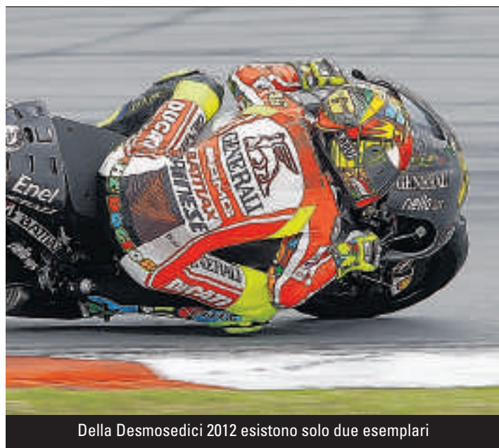
Della Desmosedici 2012 esistono solo due esemplari