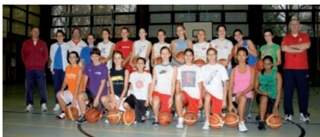
U14 - U15 F