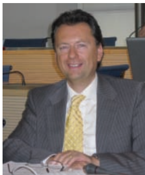
Claudio Franscella Presidente ATP

In questi primi sei mesi di presidenza ho avuto l'opportunità di partecipare a diverse assemblee e a numerosi eventi organizzati dalle varie società ticinesi e ho scoperto un mondo cestistico molto vivo e pieno di iniziative in cui, al centro dell'operato di tutti i club, vi è un'attenzione particolare al movimento giovanile. Fatto questo che è di buon auspicio per garantire un futuro importante al basket ticinese.